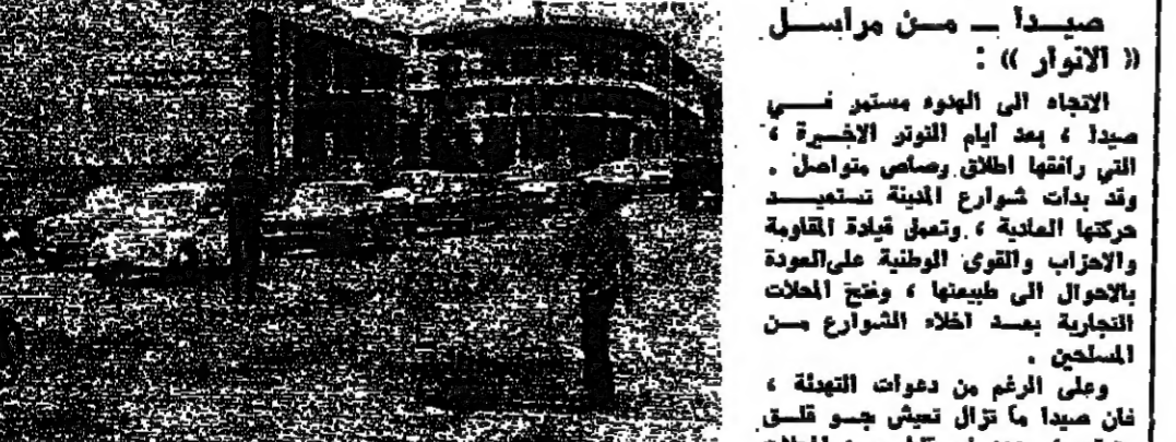
شعار الرئيسي في صيدا، وقد بدأت الحركة تعود إليه تدريجياً

الاتجاه الى الهدوء مستمر في صيدا، بعد أيام التوتير الأخيرة، التي رافقتها إطلاق الرصاص متواصل، وقد بدأت شوارع المدينة تستعيد حركتها العادية، وتعمل قيادة المقاومة والحزب والقوى الوطنية على العودة بالأحوال الى طبيعتها، وفتح المحلات التجارية بحدود اختلال الشوارع من المسلمين.